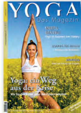
Nr. 3 / Juni 2011