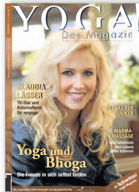
Nr. 6 / Dezember 2010