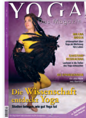
Nr. 2 / April 2011