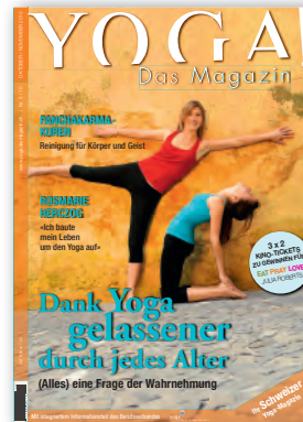
Nr. 5 / Oktober 2010