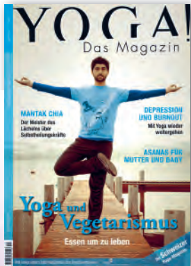
Nr. 1 / Februar 2011