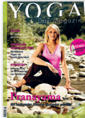
Nr. 4 / August 2011