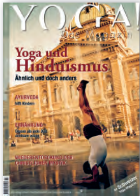
Nr. 5 / Oktober 2011