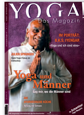
Nr. 4 / August 2010